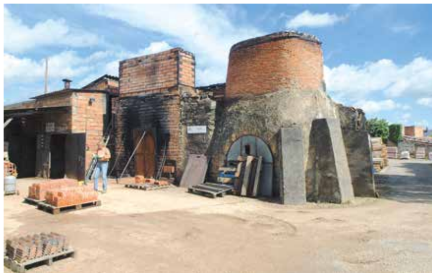
In Atelier Le Croc, een artisanale steenbakkerij in Les Rairies dichtbij Durtal, worden bijna uitsluitend tegels gemaakt. Ook de ovens worden nog ambachtelijk gestookt.

De andere kant op (D751) zoeken we in Cunault het kasteel op dat echter niet te bezoeken valt, maar dat wordt ruimschoots goedgeemaakt door de priorijkerk Notre-Dame, effenaf indrukwekkend. Romaanse robuustheid gecombineerd met gotische hoogtes. Kapitelen met fabelachtige figuren sieren het hoofdportaal.