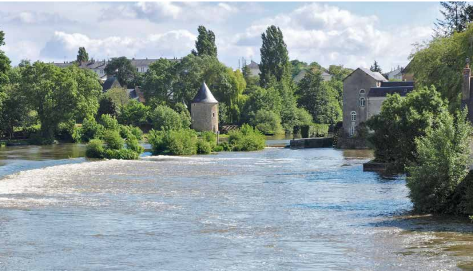
Durtal aan de breedstromende Loir, met zijn Tour du Lavoir.