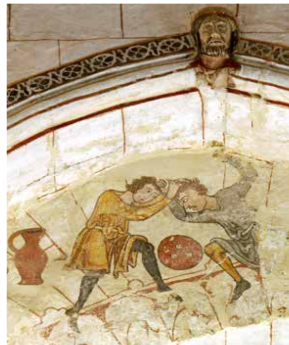
In Pontigné deze bizarre fresco: twee vechtende mannen trekken elkaar de haren uit het hoofd.