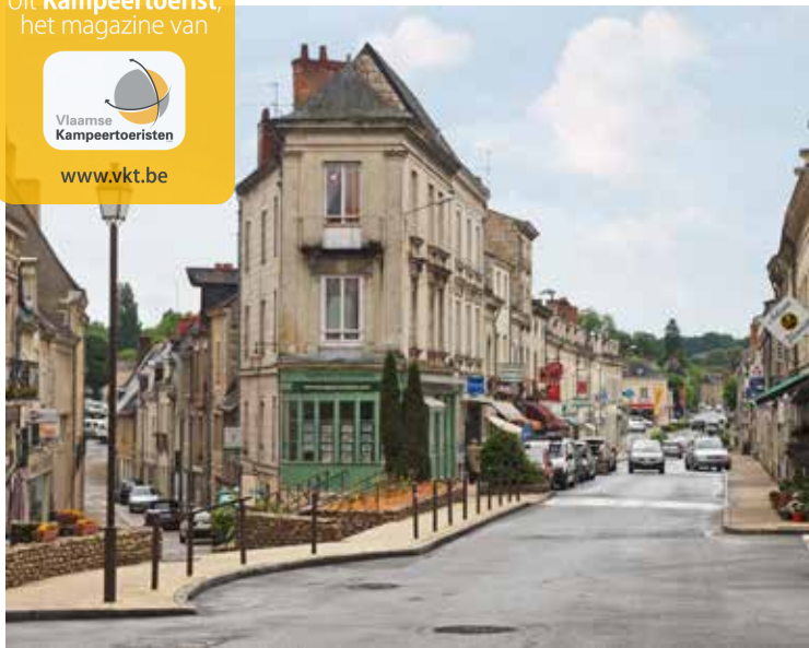
Baugé met zijn Rue Basse en Rue Victor Hugo.