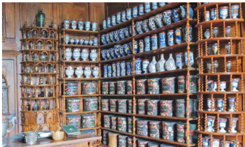
De Apothicaierie in het Hôtel Dieu van Baugé is ouder dan die van Baune. Het bleef als ziekenhuis in gebruik tot 2001.

Net buiten Baugé ligt verscholen in een park van 60 ha de Manoir van Clairfontaine. We betreden met enige schroom een van de meest authentieke middeleeuwse 'manoirs' (n.v.d.r. landgoed) van de streek. De hele geschiedenis van het Pays Baugeois tussen Loire en Loir komt hier opnieuw tot leven. Oorspronkelijk een grote schuur met kapel (12de eeuw) die als tiendenschuur fungeerde van een cisterciënzerabdij. Later overgenomen door kleine adel die de schuur omvormden tot residentie, weg van de grote kastelen langs de Loire. Het woongedeelte werd comfortabel ingericht en men leefde er koninklijk van de opbrengst van het land dat men door anderen liet bebouwen. Zo ontstond de 'manoir'. De huidige eigenaar, gepassioneerd door de middeleeuwen, liet de 'manoir' met de oude kapel volledig in zijn 15de-eeuwse toestand restaureren en renoveren. Het meubilair samen met de (Vlaamse) wandtapijten harmoniëren met moderne kunstwerken en creëren een feestelijke, warme en familiale sfeer. In het park dat een klein dierenrijk huisvest, staat de picknicktafel voor je klaar. Het Pays Baugeois als uitloper van de vallei van de Loir heeft alles in huis om menig toerist aan te trekken, maar onbekend maakt ook hier onbemind. ■