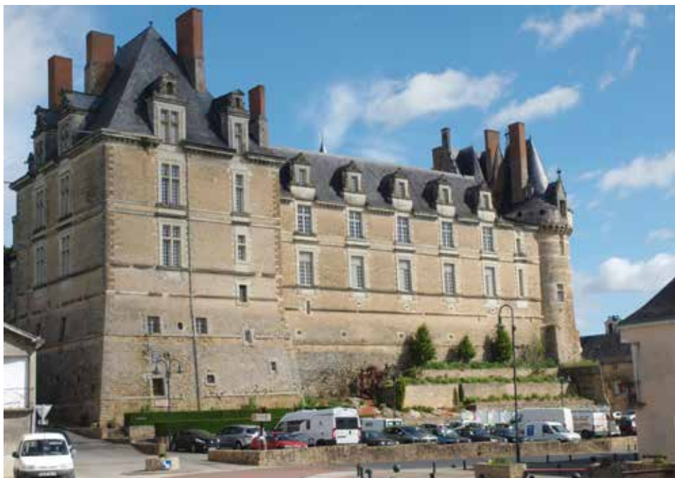
Durtal pronkt met zijn hooggelegen kasteel, heersend over de Loir en over de weg Parijs-Nantes.

Baugé is toeristisch gezien een ondergewaardeerde stad. Het kreeg vrij recent de titel 'Petite Cité de Caractère'. Koning René, hertog van Anjou, liet er in de 15de eeuw een kasteel bouwen dat zijn geliefde residentie werd. Wat nu de Place de l'Europe is, was vroeger een ommuurde vesting op een uitstekende rots. De hele geschiedenis wordt in een filmisch spektakel voorgesteld in het kasteel. Het koninklijk verblijf bracht uiteraard een rist edellieden met zich mee die in de omgeving hun optrekje lieten bouwen. In de bossen van het Pays Baugeois konden ze weelderig op jacht gaan. Vandaar de vele rijke verblijven in