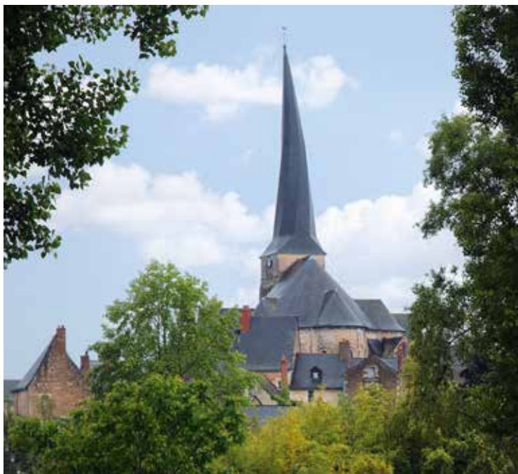
De schroefvormige toren van Vieil Baugé staat er bovendien gebogen bij. Zo gewild door de meester-bouwers als prestigestuk.