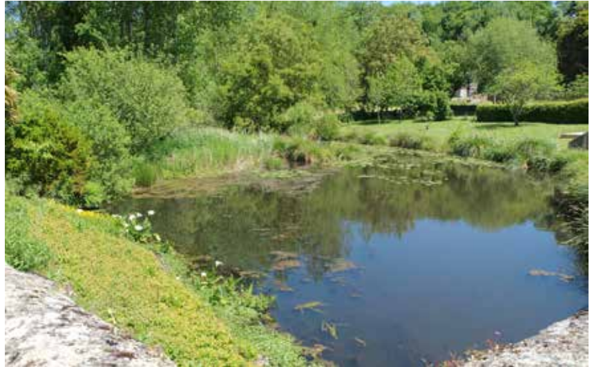
In Mouliherne treffen we dit romantisch plekje aan langs de rivier Riverolle.

Op naar het noorden, richting Vallée du Loir. We gaan op zoek naar een artisanale steenbakkerij in Les Rairies, dichtbij Durtal. In het Atelier Le Croc wordt nog volledig ambachtelijk gewerkt, bijna uitsluitend tegels. Rode, ijzerhoudende klei wordt manueel met grijze klei gemengd. De tegels gaan de met hout gestookte oven in tot een temperatuur van 800 °C wordt bereikt en dat voor ongeveer 35 uur. Daarna volgt een droogproces van één tot anderhalve maand. Elke tegel wordt ter hand genomen en met het oog en oor gecontroleerd. Geen twee gebakken tegels zijn gelijk, dat is het kunstige resultaat. Sinds de 15de eeuw gaat men hier zo tewerk. De oudste van de drie ovens dateert uit 1758. De tegels Le Croc zijn onder meer te bewonderen in heel wat kastelen langs de Loire en de Loir. Van de tientallen kleine steenbakkerijen in de streek blijven er nu nog drie over.