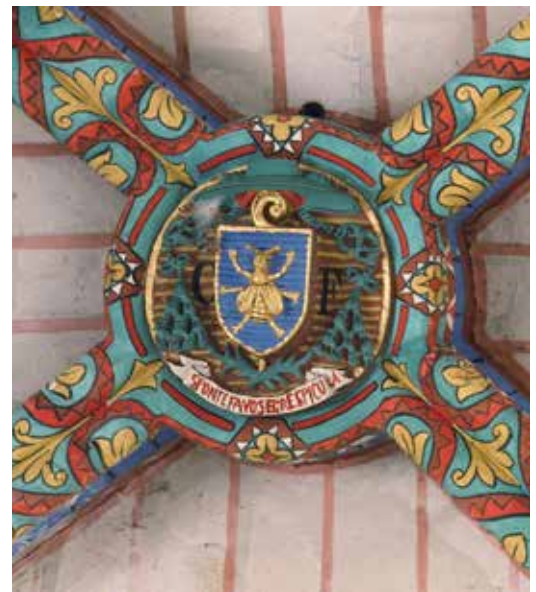
In het rustige Fontaine-Guérin, vinden we deze beschilde zoldering met versierde sluitsteen.