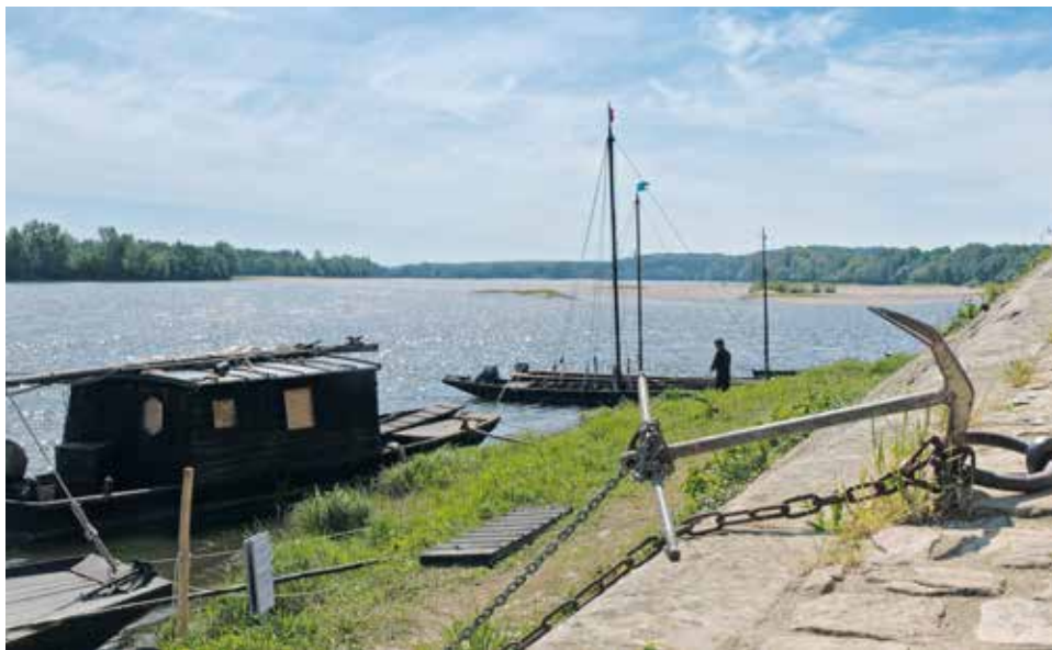
De majestueuze Loire in Le Thoureil, een ideale plek voor een picknick.