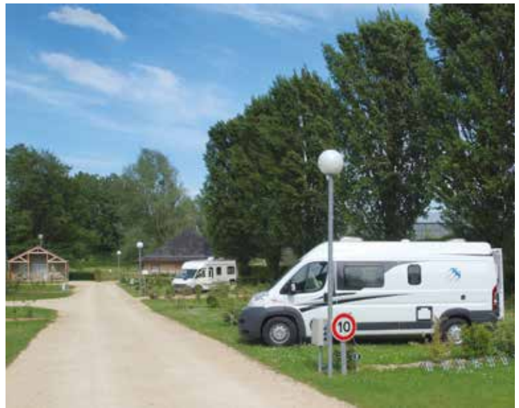
Camping Municipal Le Pont des Fées in Baugé-en-Anjou.