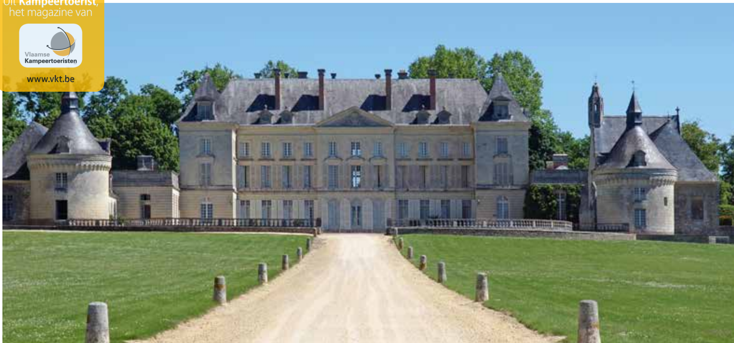
Het kasteel Montgeoffroy, een schoolvoorbeeld van klassieke architectuur, ligt langs de weg even voor Brion.