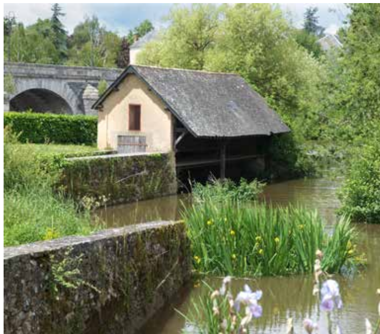
Een wandeling in het kwartier Saint-Léonard, over de brug langs de Loir, levert dit middeleeuws tafereel op.