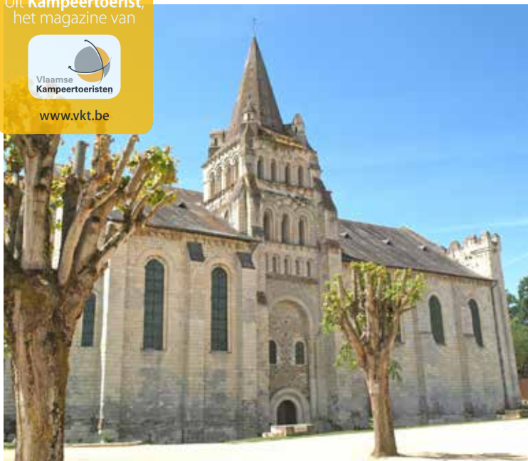
De priorijkerk Notre-Dame in Cunault, met haar hoekige toren in het midden, vertoont romaanse trekken.