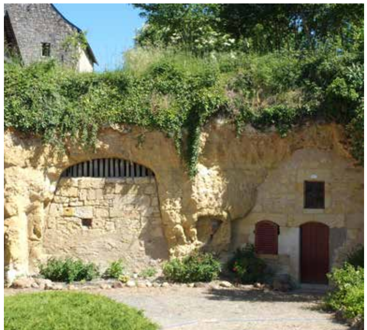
Op wandel in Cornillé-les-Caves ontdekken we inderdaad deze 'caves (troglodytiques)' die holwoningen blijken te zijn, verscholen in groen.