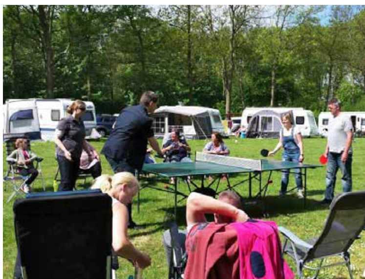
Tafeltennis met supporters op het NCC-terrein De Lepelaar in Brielle.