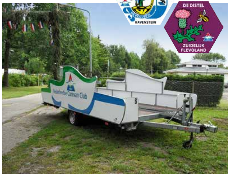
Deze grote 'Klomp' wordt soms gebruikt bij rijvaardigheidslessen.